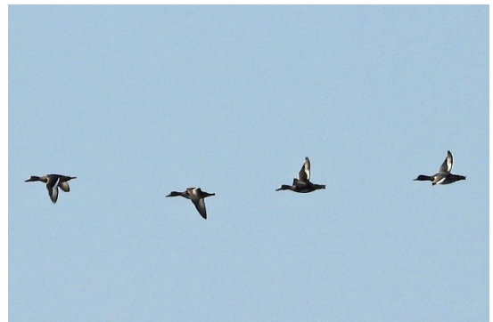
スズガモ

家が龍恋の鐘にキビタキが居ると言っていた。海ではスズガモの群れ(A氏写真判定)が飛来、イワシの群れに飛び込むウミネコの群れ。江の島も冬鳥で賑やかになってきました。