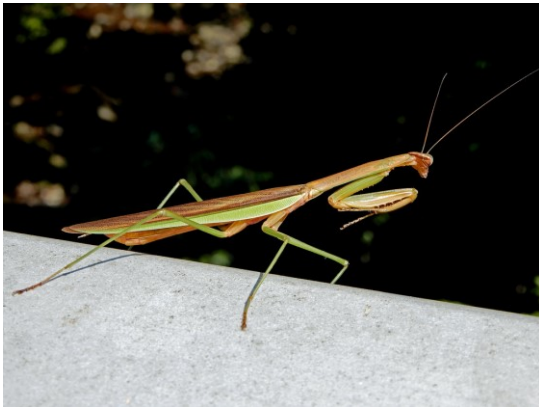
チョウセンカマキリ

丸太の森公園へは細い山道を峠越え、道は雨で削られ根っこが剥き出しで歩きづらい。遙か遠くでカケス、キジバトの鳴き声が聞きました。公園前の自動販売機で水分補給。公園で昼食後、移設の旧小学校を見学、つり橋を渡り山草園へ赤色ピンク色のサルスベリの木、ヒガンバナが咲く道を登るが、鳥がいない。チョウやイトトンボが居るだけです。