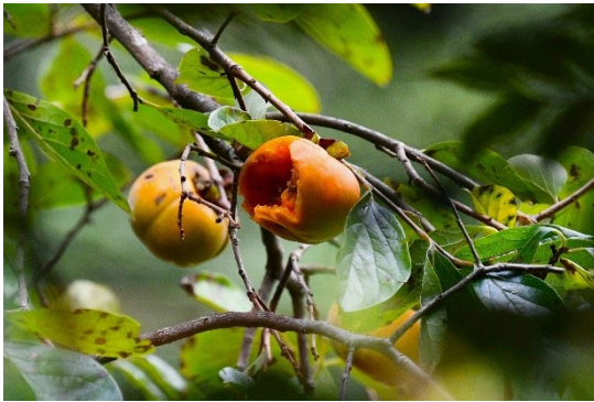
熟した次郎柿

が挙げられるが、しかしなんとといっても、我がクラブが野鳥のために植えた次郎柿の熟した実の一つに、明らかに鳥に食べられた跡であろう大きな穴が見られたことに、参加者全員が喜びあったことをご報告させていただきたい。