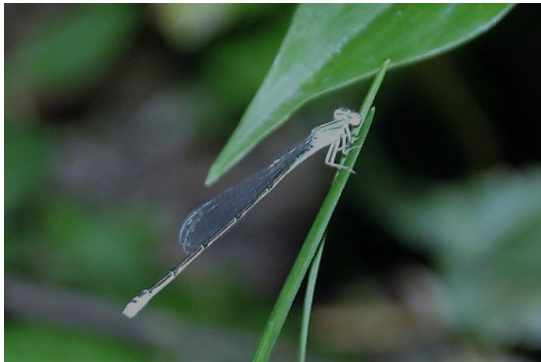
オオイトトンボか？

継続観察しているマンジュウドロホコリは、いっそう大型化して2つの塊に分裂し、一方が木の幹に残ってへばりつき、他方が根元に落下している。割れたものではなさそうで、何が生じたのか不明。