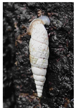
キセルガイ sp. 撮影；田中正信

その他には、先の子測が全くできない状態でさらに進化？し続けているように見えるマンジュウドロホコリの存在感がますます増していたこと、久しぶりにクヌギの樹幹に多くのキセルガイが見られたこと、など