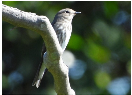
エゾビタキ

8・9月と休み、3か月ぶりの探鳥会、ヒヨドリの小さな群れが数を増し100羽以上となった。ヒヨドリの渡りが始まっています。亀ヶ岡広場では、エゾビタキがキビタキ♀(T氏写真鑑定)に体当たりされた。2羽は同じ枝の両端に留まりキビタキがすぐに立ち去る。写真