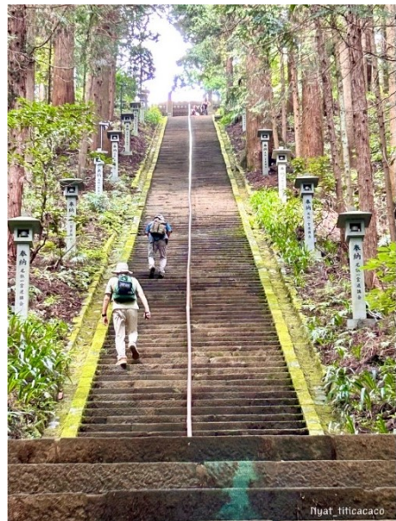
奥之院へ

大雄山駅からバスで最乗寺へ、ここは50年以上の杉が山一面に2万本も植えてあり、お寺への石段を登ると境内の池には鯉が泳いでいる。その上に鳥除けの網が張ってある。