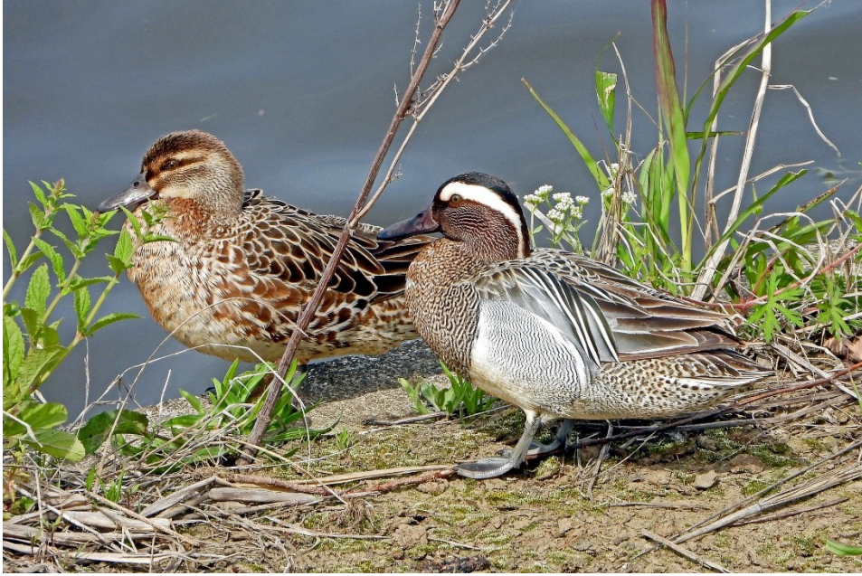
シマアジのカップル (2023年4月 藤沢市今田遊水地)