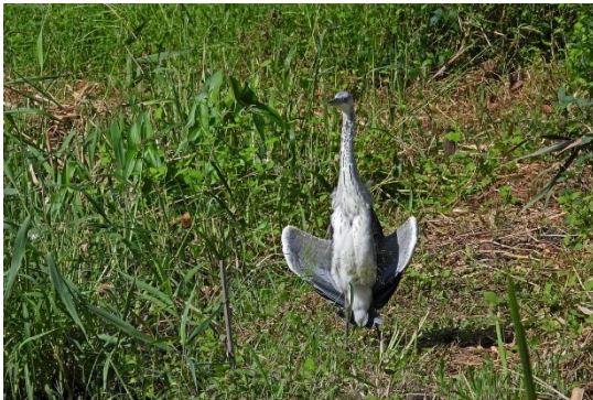
アオサギの幼鳥

柏尾川を離れ谷戸に移動しました。シジミチョウの仲間がちらほら現れて目を楽しませてくれました。畑でアオサギが佇んでました。カメラで確認すると、冠羽が未発達なので幼鳥のようです。見ていると翼を低い位置でたたんだまま広げて独特のポーズをとりました。